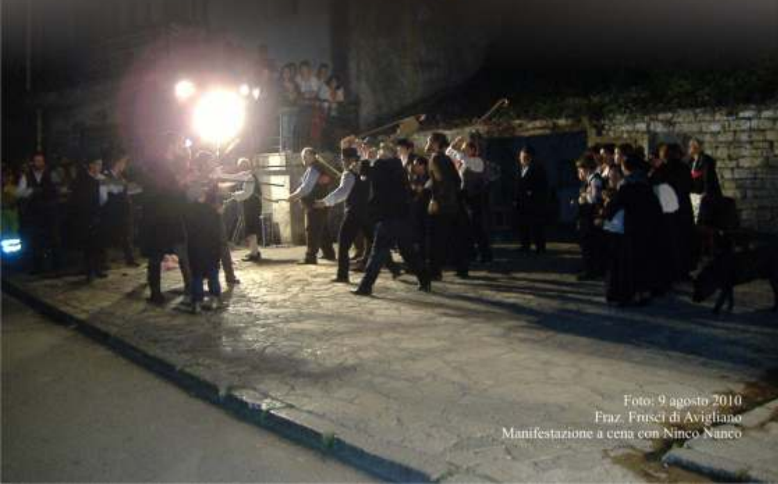
Foto: 9 agosto 2010 Fraz. Frusci di Avigliano Manifestazione a cura di Ninco Nanco