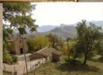
Chiesa Madonna delle Grazie