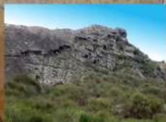
Percorso Rurale Rocca Cappello

INFORMAZIONI E VISITE GUIDATE: c/o Municipio di Albano di Lucania - (PZ)